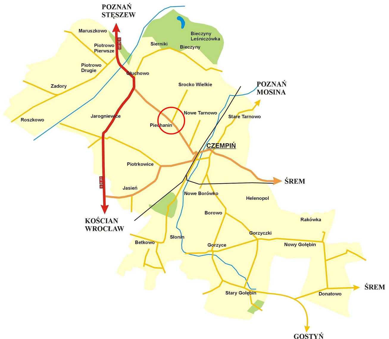
Plan gminy Czempień (rys.1)

Gmina stanowi 19,72% powiatu. Sołectwo Piechanin zajmuje obszar 575 ha i stanowi 4,04 % powierzchni gminy.