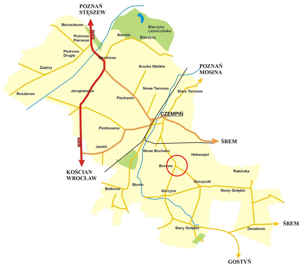
Plan gminy Czempień (rys.1)

Gmina stanowi 19,72% powiatu. Sołectwo Borowo z przysiółkami Helenopol, zajmuje 1172 ha i stanowi 8,24 % powierzchni gminy.